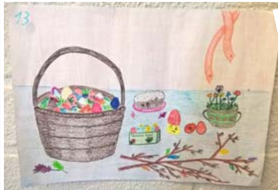
Varkauden seurakuntasalin seinät peittyivät näyttävistä pääsiäispiirustuksista koululaisten kirkkopäivänä.

Mieshenkilö vastaa numerossa 044 294 1836 ja naishenkilö vastaa numerossa 045 119 0293.